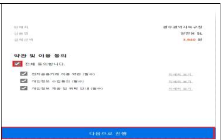
⑤ 주문 저장 후 결제하기 클릭 * 주문수정은 수정을 한번 누른 후 다시 한번 눌러주셔야 수량 변경이 가능합니다. (주문수정은 입금 완료되기 전에만 가능합니다)